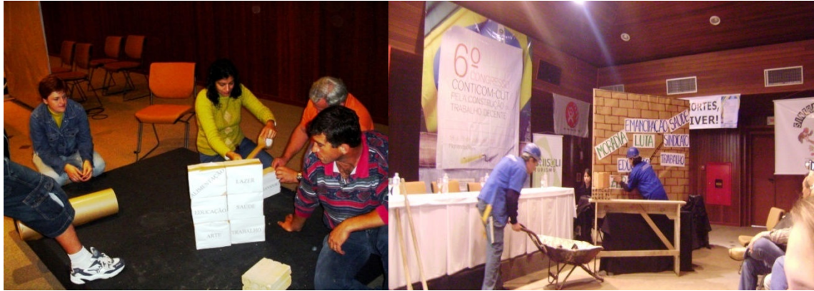
Educandos pesquisando, criando e encenando o poema Operário em Construção, de Vinícius de Moraes, para abertura do Congresso dos Trabalhadores da Construção Civil.