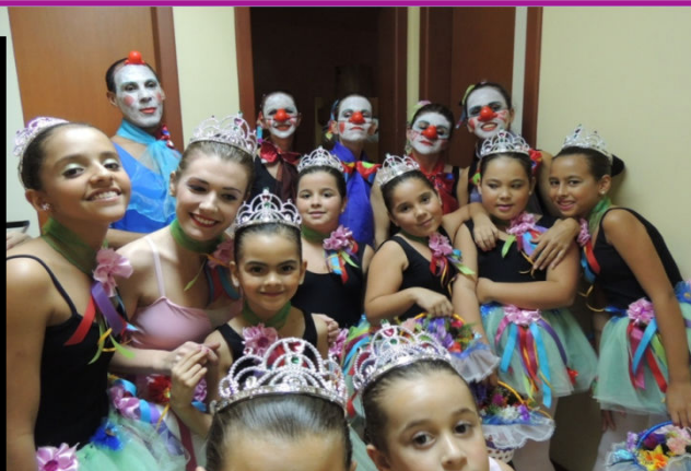
Apresentação de ballet do "Projeto Latinha" no auditório da Escola

Apresentação no auditório da Escola de ballet pelos integrantes do Projeto Latinha que oferece cursos gratuitos de ballet para trabalhadoras domésticas e suas filhas. O projeto sustenta-se na coleta de latas de alumínio, onde a escola pode ampliar a campanha para a continuidade do trabalho do grupo.