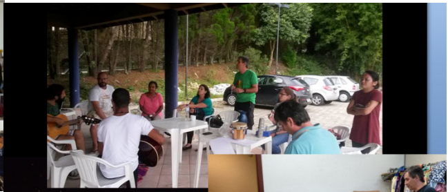
Grupo Cultural Boi de Mamão